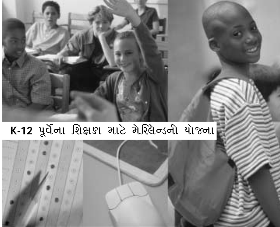
K-12 પૂર્વેના શિક્ષણ માટે મેરિલેન્ડની યોજના